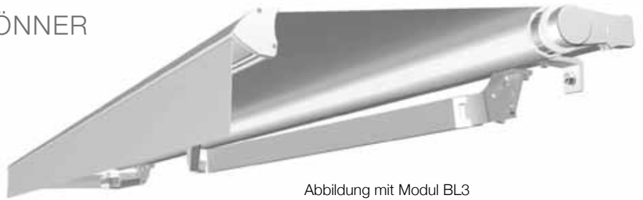
Abbildung mit Modul BL3