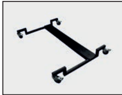
Untergestell mit Rädern