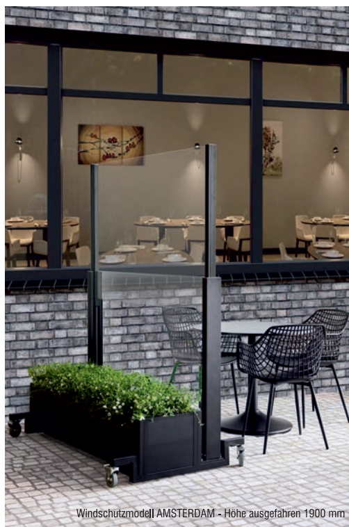
Windschutzmodell AMSTERDAM - Höhe ausgefahren 1900 mm