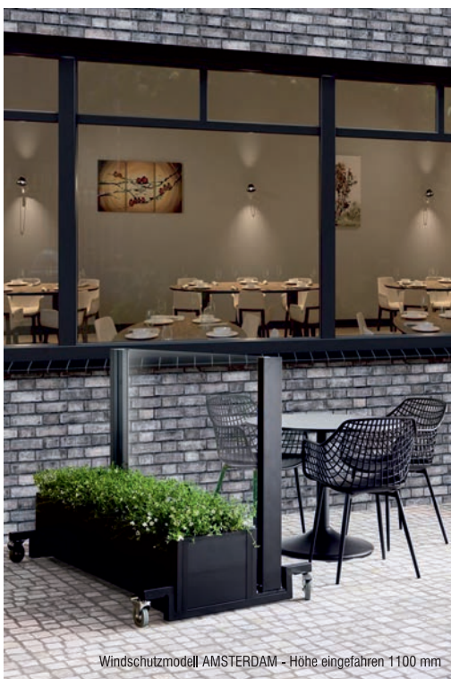
Windschutzmodell AMSTERDAM - Höhe eingefahren 1100 mm