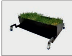
Untergestell mit Rädern und Blumenkasten

Der Sockel und die Räder können einfach unter dem vertikalen Windschutz montiert werden. Der Blumenkasten wird in der gleichen Farbe wie der Windschutz geliefert